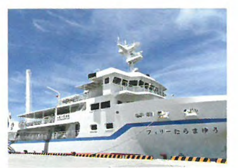
フェリー-たらまゆう