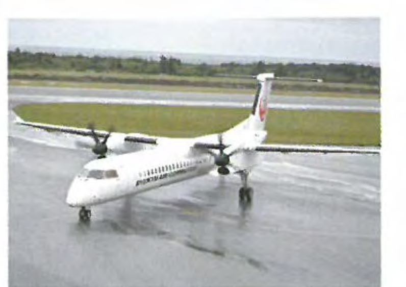
琉球エアークミューター (1日2往復)