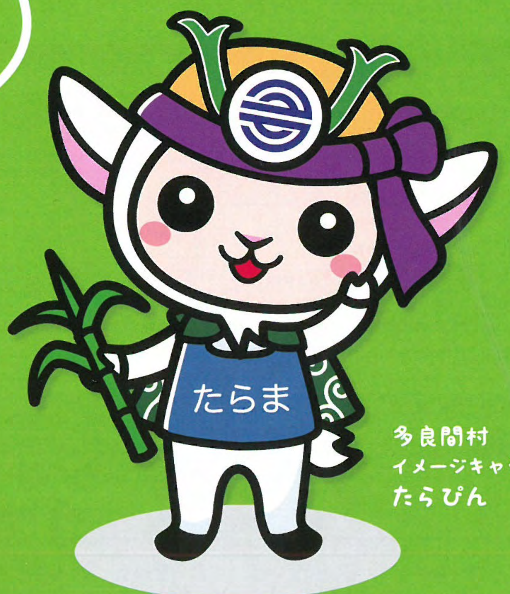
多良間村 イメージキャラクター たらびん