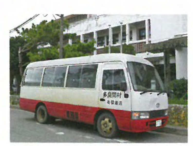
飛行機とフェリーの時間に合わせて毎日運行