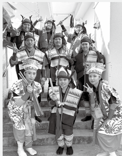
石垣から来た皆さんありがとうございました！