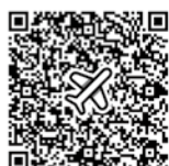
◎ 第一航空石垣営業所