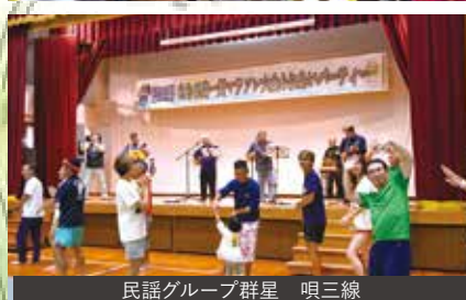
民謡グループ群星 唄三線