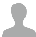
小学校 高学年男性