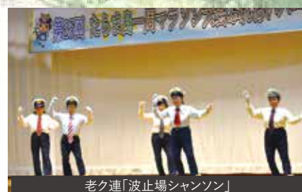
老ク連「波止場シャンソン」