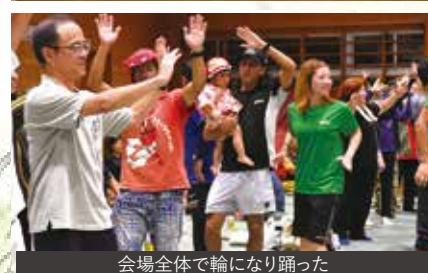
会場全体で輪になり踊った