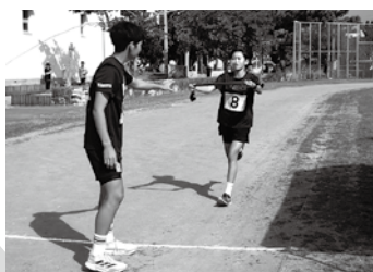
チームカラーのたすきを繋いで走る「駅伝」