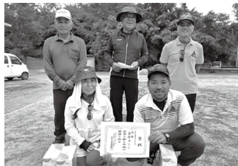
優勝した土原Dチームの皆さん

令和 7 年11月30日(日)、村営ゲートボール場において、第4回多良間村ゲートボール連合大会が行われた。ゲートボールを通して会員及び愛好者の結束を図るとともに、健康増進に努め会員相互の交流と親睦を深めることを目的に開催され、16チームが参加した。大会結果は下記のとおり。