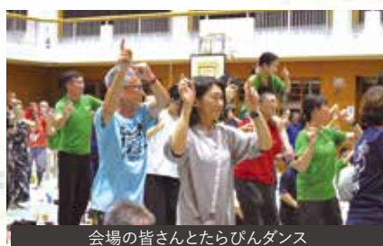
会場の皆さんとたらびんダンス