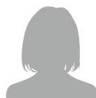
小学校 高学年女性