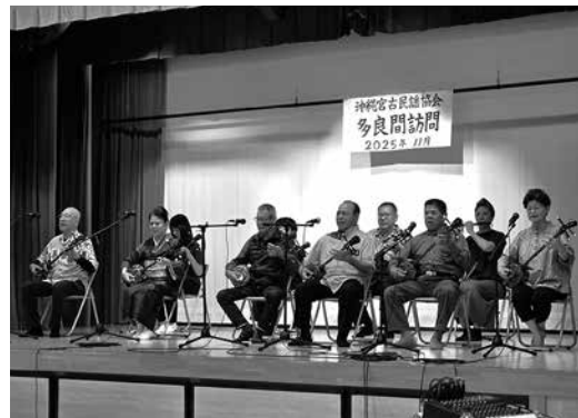
三線を演奏する沖縄宮古民謡協会の皆さん

交流演奏会では、民謡協会と文化協会の皆様による三線演奏や踊りが披露され、会場全体でクイチャーを踊り幕を閉じた。