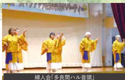
婦人会「多良間ハル音頭」