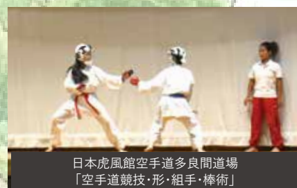
日本虎風館空手道多良間道場 「空手道競技・形・組手・棒術」