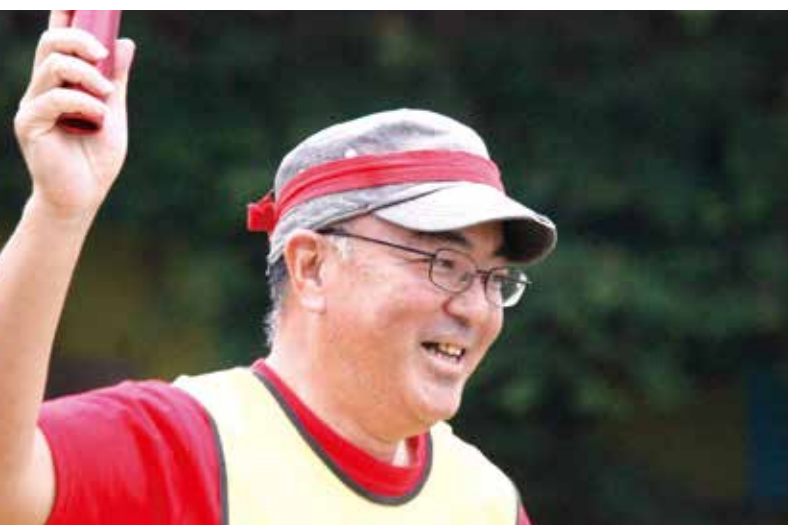
村民交流は「治安の絆」爽やかに走る眞眞 将警部補