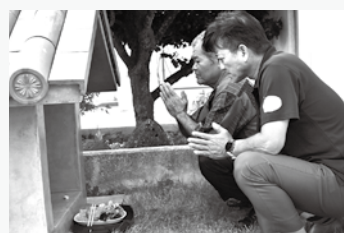
コミュニティー施設隣