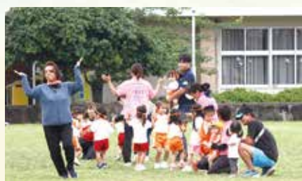
▲団体演技(保育所)元気いっぱいに踊る園児たち