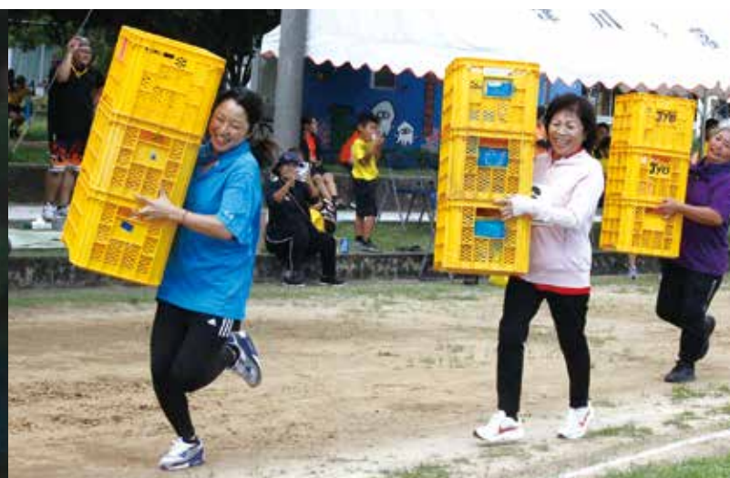
苗箱リレー(婦人)は前が見えないのがヤッカイと笑顔で走る