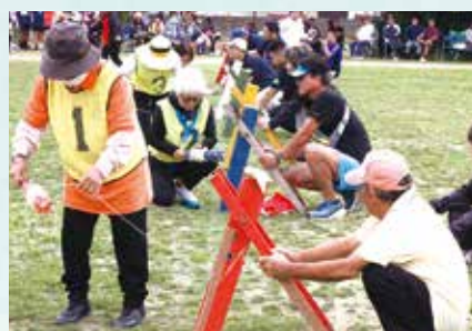
▲糸くり競争(老人・女)用具も工夫されている