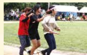
▲一致協力(代表・小)ムカデの形を3人一組の4組でリレー