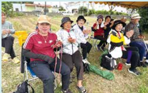
▲応援席。一喜一憂する大木の皆さん