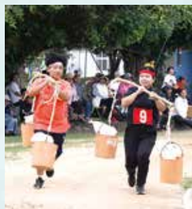
▲汐汲み競争(婦人)かつての豆腐作りの「ウブシュー」