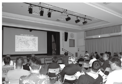
令和7年度多良間村防災気象講演会の様子