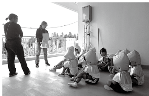
防災頭巾をかぶり避難する幼稚園の皆さん

令和7年11月5日(水)、津波防災の日・世界津波の日に合わせて、令和7年度沖縄県広域地震・津波避難訓練が行われた。この訓練は、沖縄県地域防災計画に基づき、大規模地震・津波の発生を想定し、県民等の避難行動に特化した県下全域を対象とする実践的な訓練を通して、地震・津波に対する防災意識の啓発や津波避難計画等の検証を行うことにより、地震・津波災害にかかる防災体制の向上を図ることを目的としている。