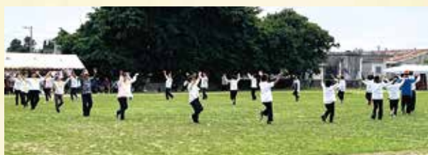
▲団体演技(老く連)輪になって踊る老人クラブ連合会の皆さん