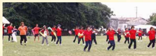
▲団体演技(婦人会)息の合った演舞を披露する婦人会の皆さん