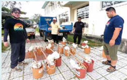
▲これは「汐桶」ですと、裏方の準備係の皆さん