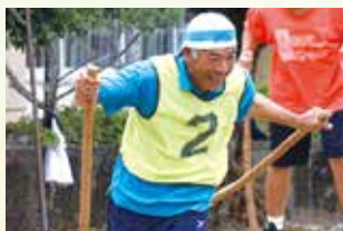
▲竹馬競争(代表・小・中)この種目から、いよいよ競技は始まる