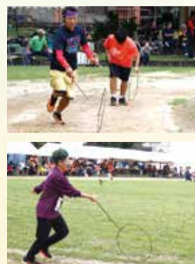
▲ワーガニマース(代表・小・中)思う方向に進まないのが厄介だ!