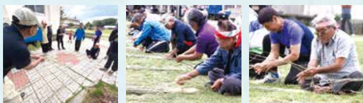
▲ナワナイ(老人)と厳しい審査風景。基準は長さとキビを縛れる強さ