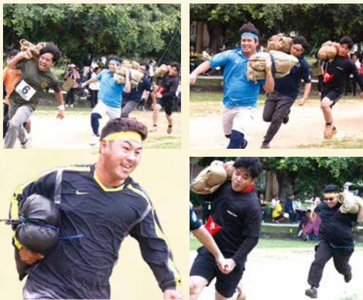
▲俵運び(代表)20・30代(20kg)、40・50代(10kg)担いでリレー