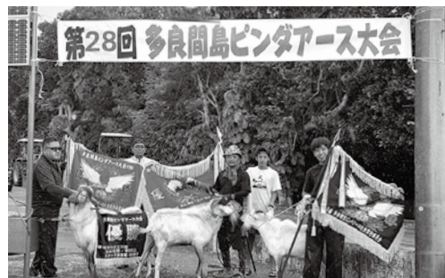
各階級で優勝したピンダと飼養者の皆さん (左から中量級優勝 レッドサンダー、重量級優勝 ガラガラドン、 軽量級優勝 波)