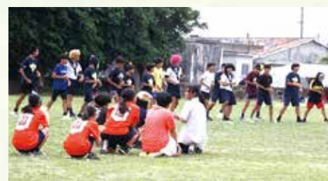
▲団体演技(中学生)飛入りでハロウィン3日後、仮装で踊る