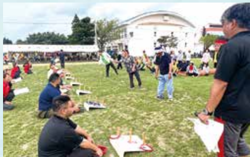
▲点とり輪(老人)2m先の3本のボールに輪投げで点数を競う