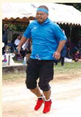
▲両足とび(代表)両足をしばり、百m×4人でリレーするハードな種目だ