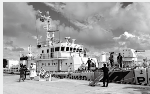
巡視船まえばま(長さ43m、幅7.8m、総トン数200t)