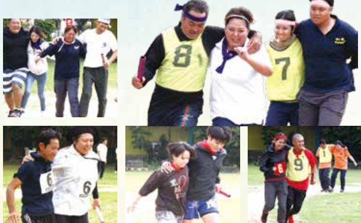
▲二人三脚(代表)パートナーとの呼吸が大事