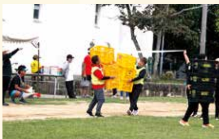
▲苗箱リレー(婦人)ゴール風景