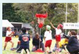
▲玉入れ(幼稚園児)あか組、しろ組対抗戦。玉のお片付けも競い合う