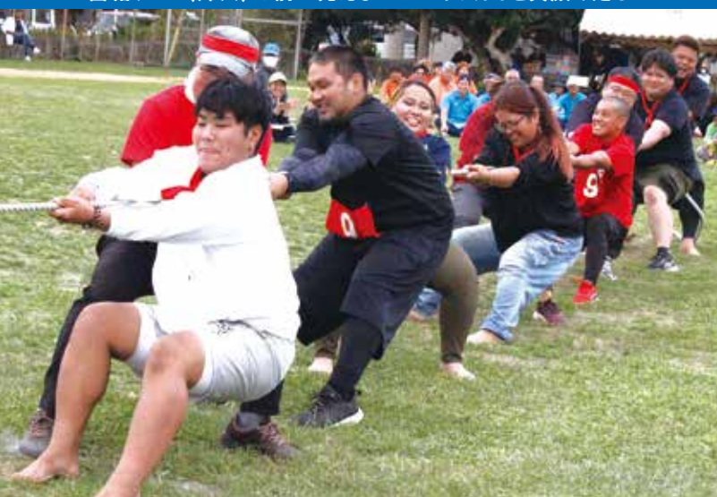
綱引きは「力」だけでは勝てない。技とチームワークだ! そして気合いが肝心だと、ベテランはゲキを飛ばして引く