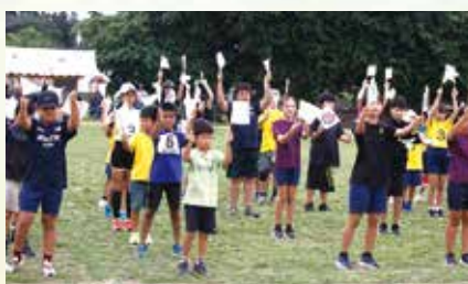
▲団体演技(小学生)校章と村章を手に校歌を踊る