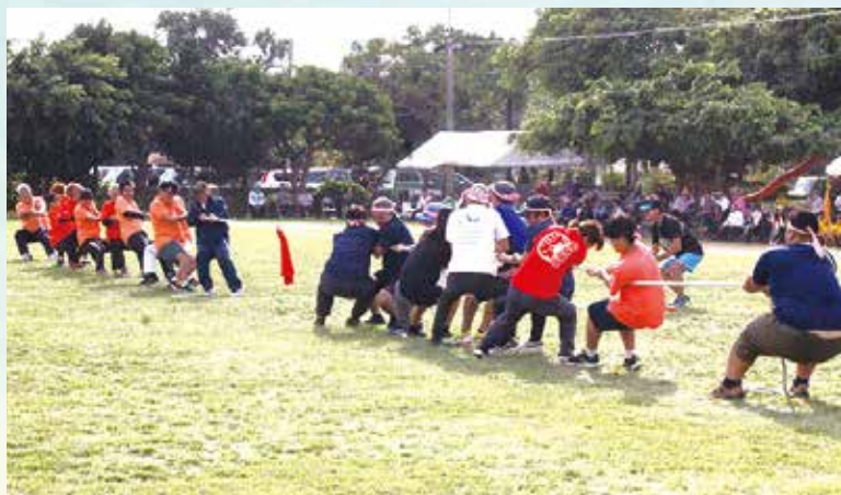
▲綱引き(代表)各区の対抗意識で勝負する