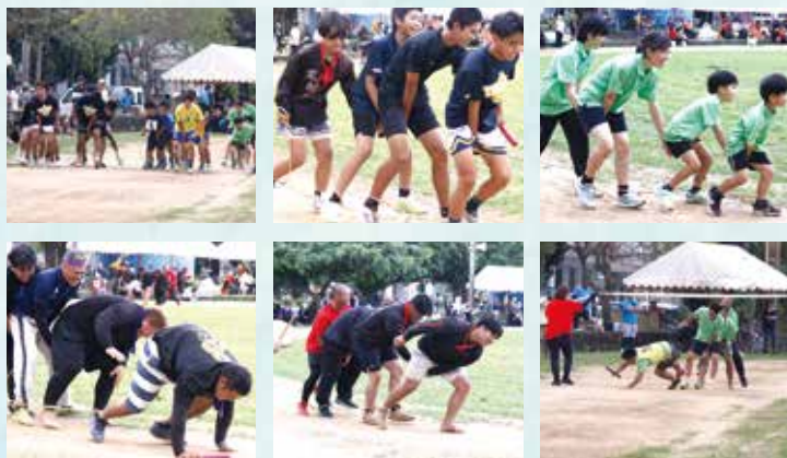
▲イモムシ競争(代表・中)縦一列に足を縛り股の下から手をつなぐ厳しく爆笑の競技