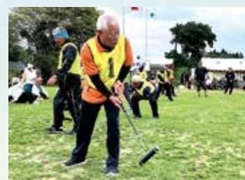
▲同点決勝(老人)4m先のゲートを狙う