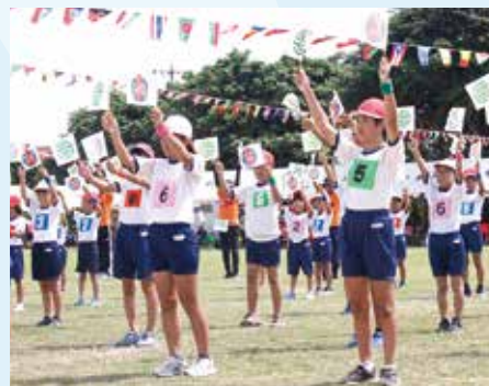
村旗、校旗を両手に、小学校校歌遊戯