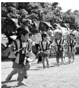
エイサーを披露する園児