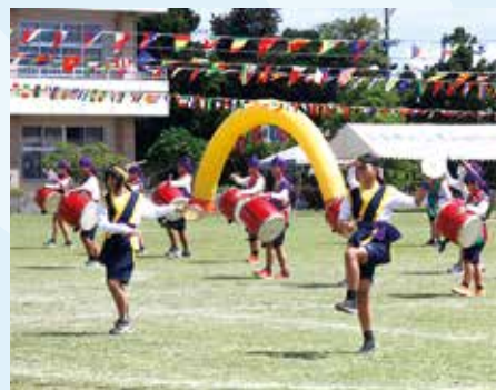
中学生によるふしゃぬふエイサー