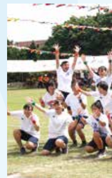
中学生によるリズム