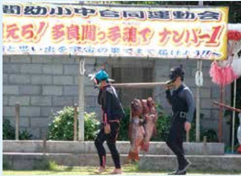
まっじくっじりレーで、射止めた高級魚「アカジン」を持参して誇らしげに担ぐ北海人の皆さん