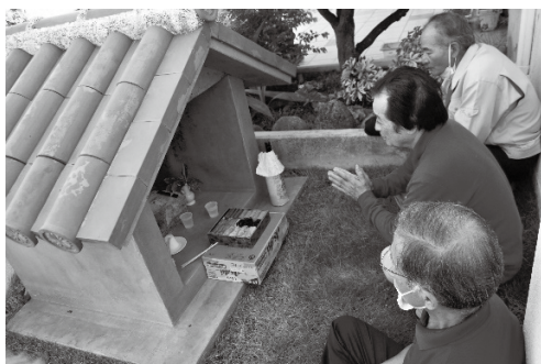
コミュニティー施設