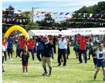
自由参加による地域の踊りで タラピンダンスを踊る皆さん