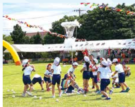
小1・2・3年生による玉入れ。児童も観客も玉の数えに一喜一憂