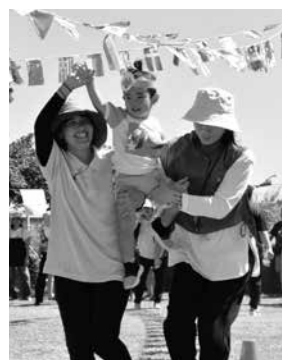
親子での触れ合い