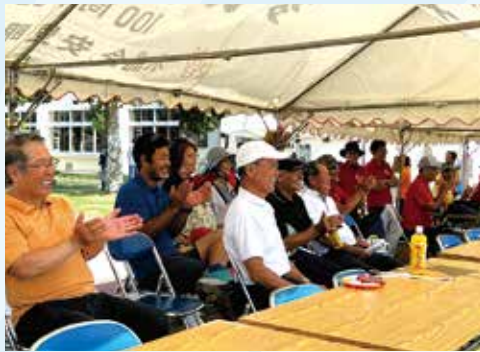
本部席・来賓席で演技を見守り声援を送る