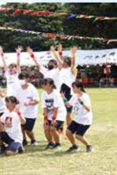
ダンスでガッツポーズ