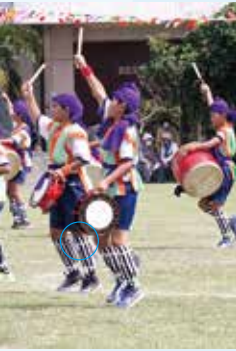
ふしゃぬふエイサー