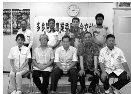
農業委員辞令交付式終了後 集合写真

農業委員・推進委員ともに任期は令和5年10月1日から令和8年9月30日の3年間。