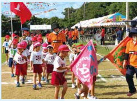
開会式を終え元気に退場する園児の皆さん