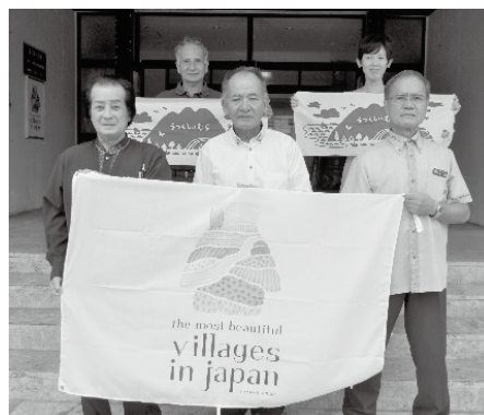
連合旗掲揚 役場前にて