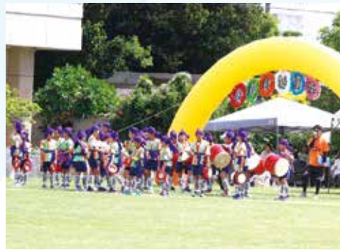
出番を待つ小4～6年生の皆さん