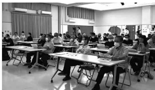
意見交換会の様子