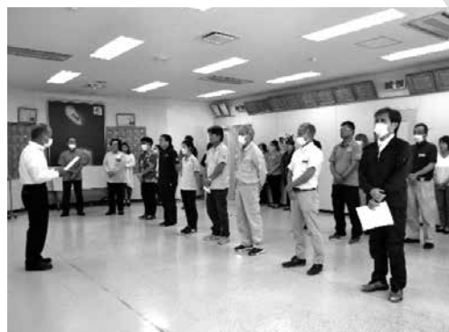
令和5年度下半期職員会の様子