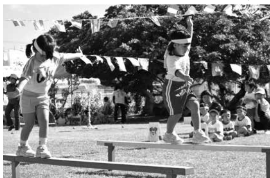
平均台を上手に渡る