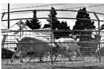
重量級決勝戦 左)リュウオー2号 対 右)大空1号

今大会はピンダアース大会“NEW”イベントとし「優勝ピンダあてクイズ」(大会前の事前応募)も実施された。