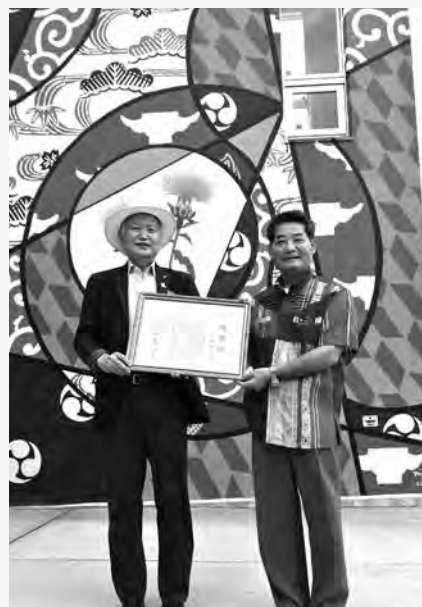
感謝状贈呈式 地域振興拠点施設

アートとデザインの表現が魅力の壁画は、地域振興拠点施設を彩り島の新しい顔として親しまれている。