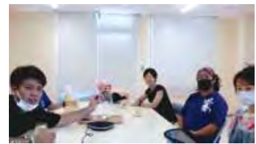
コワーキングスペースでオンライン座談会(地域振興拠点施設内)

場し、ツアー参加者からの生活する上での苦勞、医療体制、住居の現状など多くの質問に対し、多良間で生活する方が、リアルな生活の様子を忌憚なく話されると、ツアー参加者は驚いたり、笑ったりと大いに盛り上がりました。