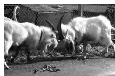
本能なのか…対戦前に闘う待機中のヤギ