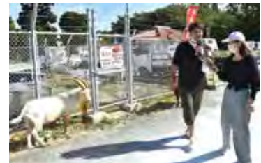
ピンダアース大会の様子を案内