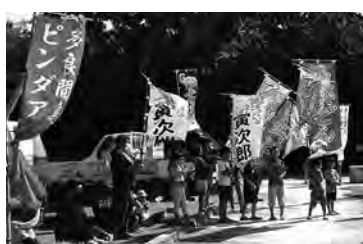
のぼりを掲げ応援!