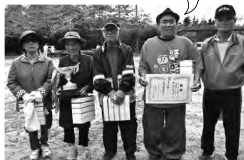
優勝 大道 A チーム 村営ゲートボール場