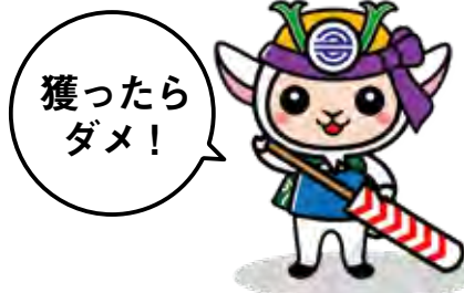
多良間村キャラクター「たらびん」