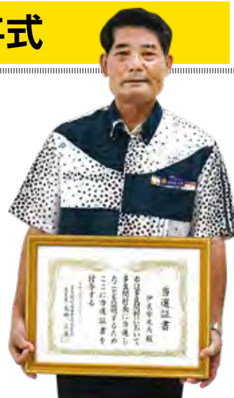
当選証書付与式 多良間村役場2階会議室

多良間村議会福嶺常夫議長は「村の振興の為に創意工夫し、住みよい村づくりの村政運営に取り組んでもらいたい。」と激励の言葉を述べた。