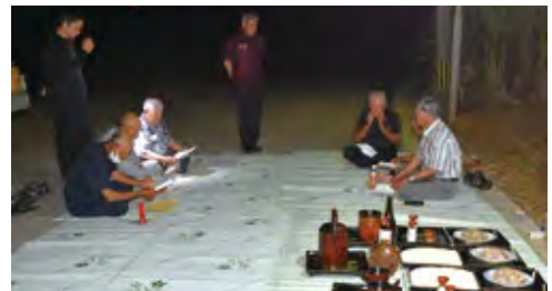
アカツキヌニガイでニリを唱える (ウイヤー)

6月13日の午後9時過ぎに、アカツキヌニガイの準備が行われ、ウイピートウ座では、供える品を並べ確認を終えると祭場へ向い、準備した上酒・中酒・シュリザカナ等を供え豊作を祈願した。