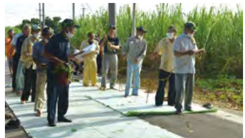
祭り最終日の早朝行事 (ウイヤー)