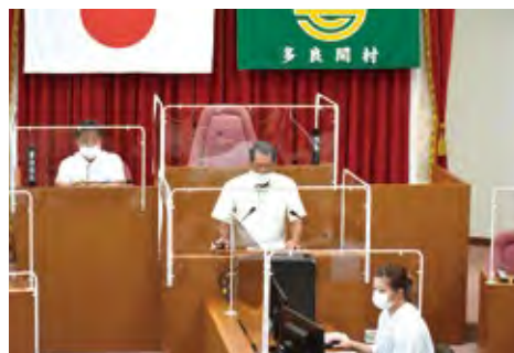
令和3年第2回多良間村議会臨時会