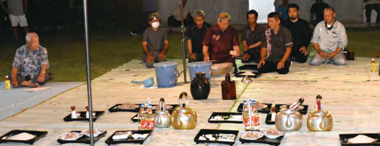
アカツキヌニガイに供える品の確認