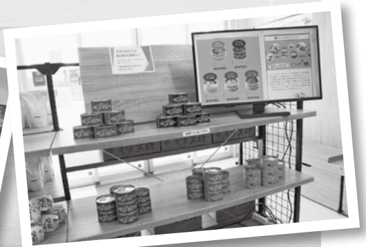
テレビで話題のサヴァ缶 5種