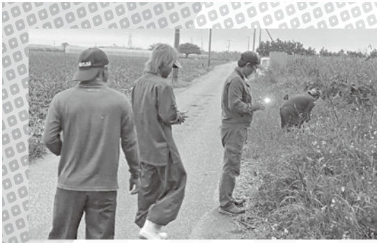
仲筋字はカミディ、塩川字はタニガーのユウヌフツで害虫をとる。