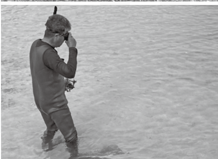
害虫をのせた小舟を海中に投げ捨てる

ウプリは、害虫よけの行事でもあり、農民の謹慎の日でもある。かつては、村はずれの四辻に火を燃やして、畑仕事をしてはいけないと告げていた。