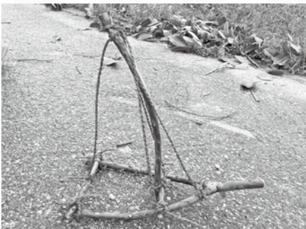
害虫をのせる小舟