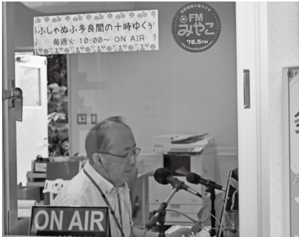
ふしやぬふ多良間の十時ゆくう 毎週火曜日 10:00~ ONAIR

(一社)多良間村ふしやぬふ観光協会事務局内に設置されたFMみやこ中継局で4月6日火曜日、午前10時より「ふしやぬふ多良間の十時ゆくう」が放送された。新番組初日は、観光協会後藤事務局長が島のイベントやすまむぬたらまについて紹介。今後は観光協会職員や村民の出演も予定しており、村民の方からの情報も募集中。