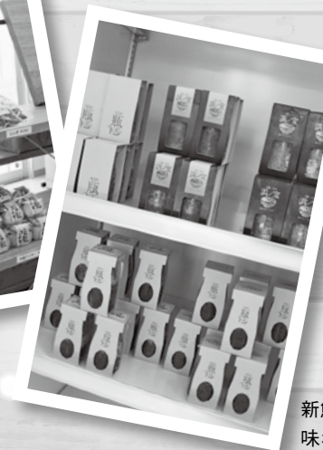
新鮮なウニが 味わえる瓶ドン