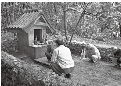
イビの拝所で豊作を祈願

3月29日にイビの拝所などで、害虫を小船に乗せて海に流し農作物の豊作を願う伝統行事ウプリが行われた。早朝から両字の役員や実行委員が害虫を採取し、葉に包み、用意した小舟にのせ、イビの拝所の前に置いて、この虫と共にすべての害虫が死に絶えますようと祈願する。