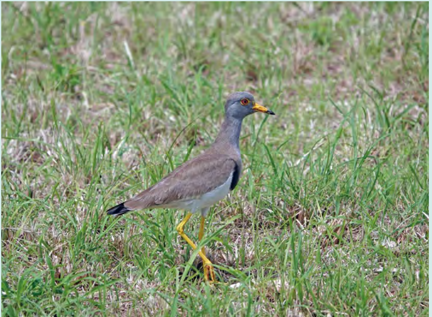
多良間村内の草地（3月末撮影）

発行/多良間村役場・編集/総務財政課広報係 〒906-0692 宮古郡多良間村字仲筋 99-2 ☎0980-79-2011