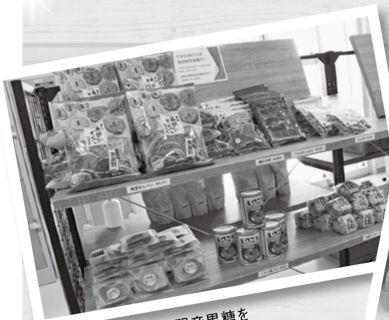
南部せんべいや多良間産黒糖を使用したバームクーヘン