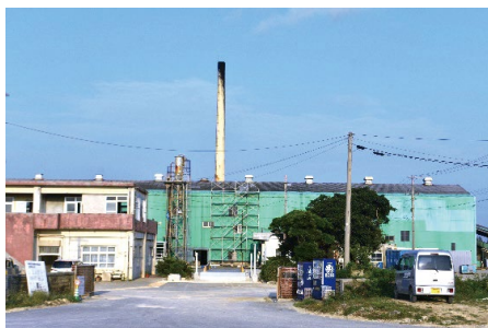
もうすぐこの工場は見られなくなってしまう