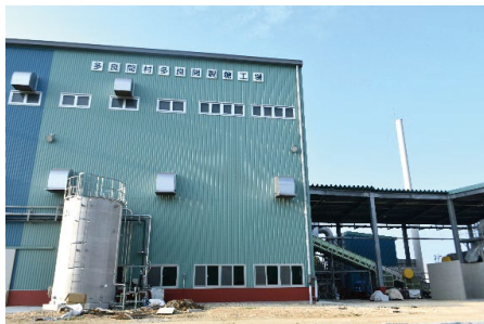
新工場。右側の煙突は建屋に隠れてしまうほど