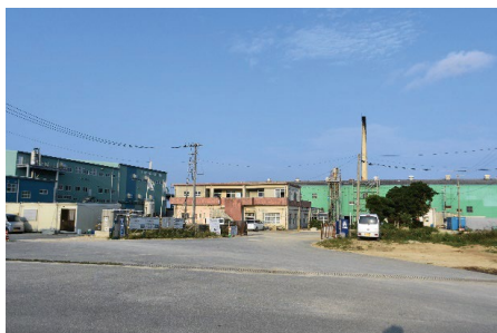
二つの工場が一度に見られるのも今だけ