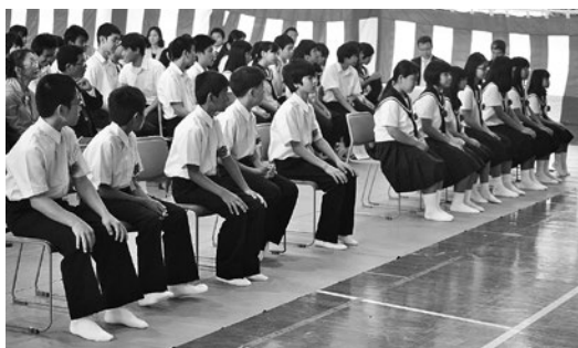
勉強、スポーツ、遊びなど悔いのない3年間を過ごして欲しい。

4月7日、村立多良間中学校に於いて平成29年度の入学式が行われ、12名の新入生が入学しました。