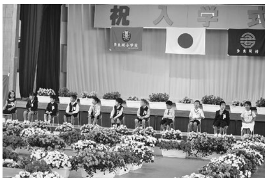
はばたけ多良間っ子

4月10日、村立多良間小学校に於いて平成29年度の入学式が行われ、12名のぴかぴかの1年生が入学しました。