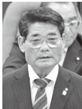
多良間村長 伊良皆 光夫