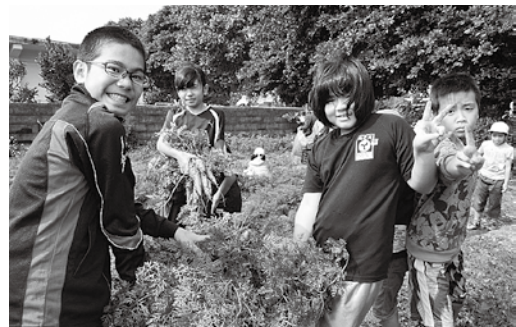
こんなに獲れたよー重いよー