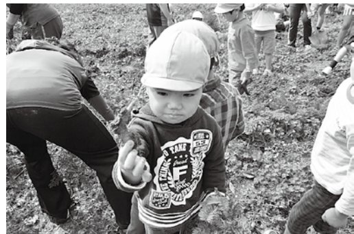
このニンジン曲がっているなー