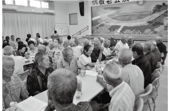
昔の話しに花が咲く