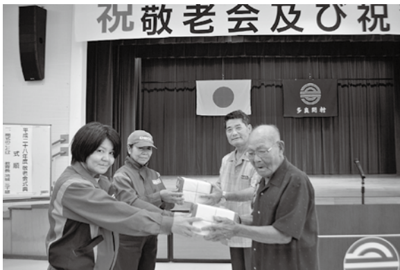
多良間興産より参加者全員へケーキの贈呈がありました