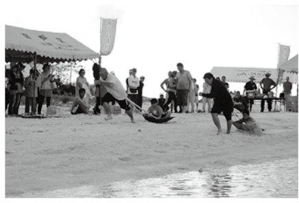
初めての間車馬も盛り上がりました