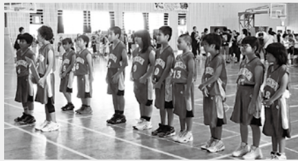
飛行機の時間が迫っているので多良間小チームだけ先に準優勝の表彰を受けました

こういうときほど、郷友会の皆さんが駆け付けてくれたらなあ〜と 思っています。 (保護者談)