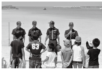
宮古島海上保安署による人命救助の講習