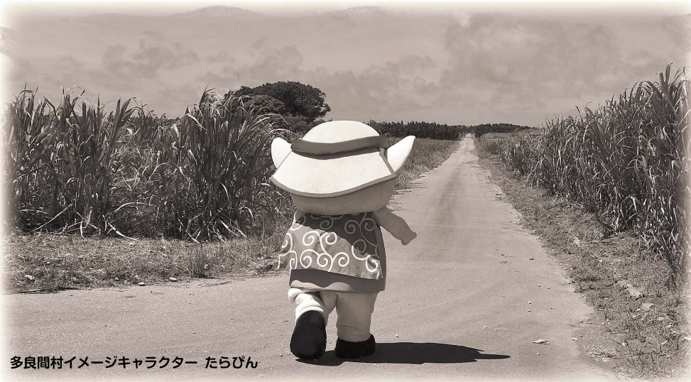
多良間村イメージキャラクター たらびん