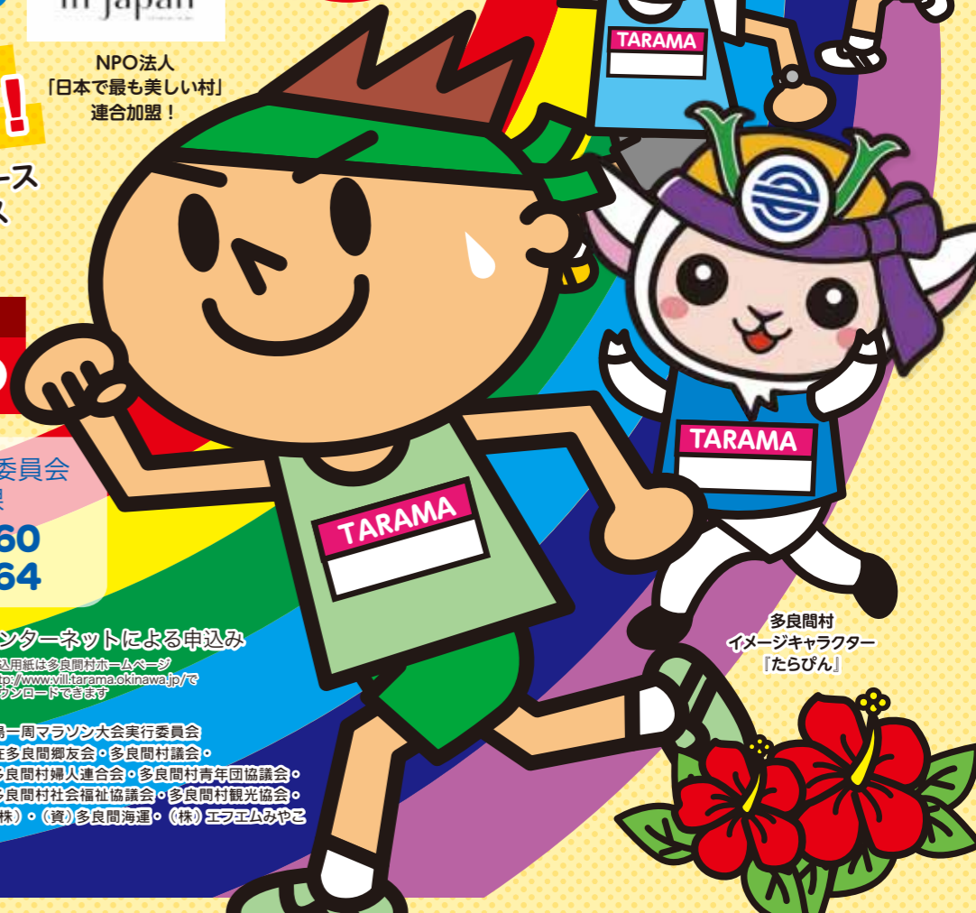
多良間村 イメージキャラクター 「たらびん」

申込用紙は多良間村ホームページ http://www.willtarama.okinawa.jp/ ダウンロードできます 主催/多良間村 共催/多良間村体育協会 主管/たらま島一周マラソン大会実行委員会 後援/在沖縄多良間郷友会・在宮古多良間郷友会・八重山在多良間郷友会・多良間村議会・ 多良間村教育委員会・多良間村老人クラブ連合会・多良間村婦人連合会・多良間村青年団協議会・ 多良間村農漁村生活研究会・多良間村農業委員会・多良間村社会福祉協議会・多良間村観光協会・ (株)宮古毎日新聞社・宮古新報(株)・宮古テレビ(株)・(資)多良間海運・(株)エヌエムみやこ 協力/宮古島警察署