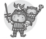
複十字シール運動キャラクター 結核と闘う「シールぼうや」

新規結核患者の3人に1人は80歳以上の高齢者です。高齢者は若い頃に感染し、眠っていた結核菌が体力や免疫力が落ちるにしたがって目を覚まし、発症することがあります。歳をとると結核の症状を自覚しにくく、手遅れになりやすいため特に注意が必要です。