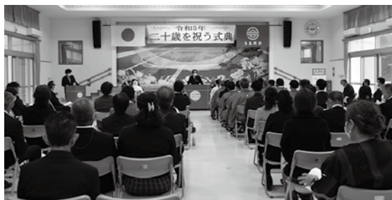
二十歳を祝う式典 コミュニティー施設