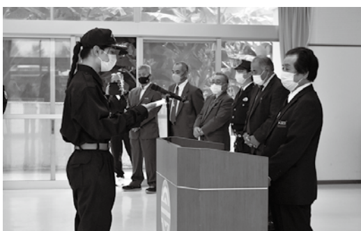
一日消防団長 答辞

伊良皆村長(来間総務財政課長代読)は、「災害発生時には、被害を少なくし、一人でも多くの命を救うためには、地域の防災力を強化し、災害等に備える仕組みづくりを整備する必要がある。出