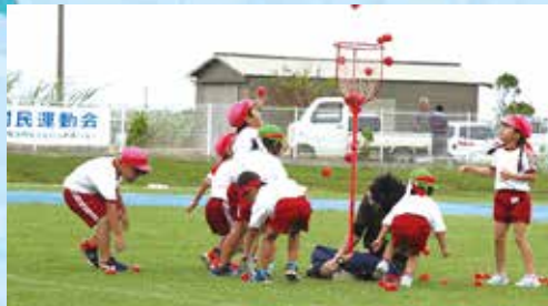
幼稚園児による「玉入れ」 園児は籠に集中、役員が支柱を支える微笑ましい光景