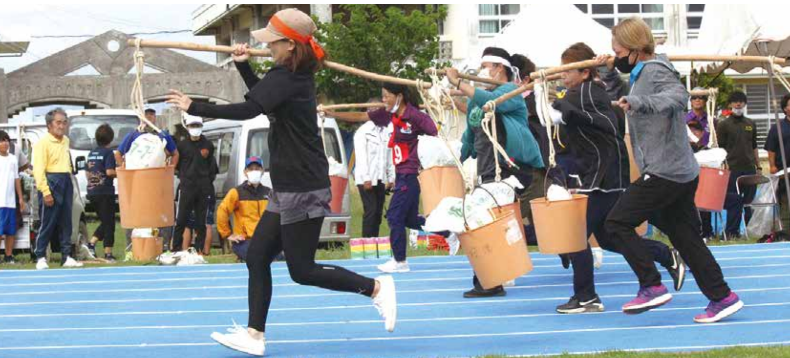
写真 (上左) ワーガニマース (代表・小・中) (上右) ナワナイ (老人) (下) 汐波み競争 (婦人)