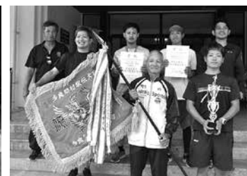
一般の部 優勝 大道チーム