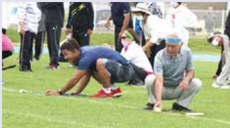
ゴルフ並に芝目、コースを読む?本格派の選手