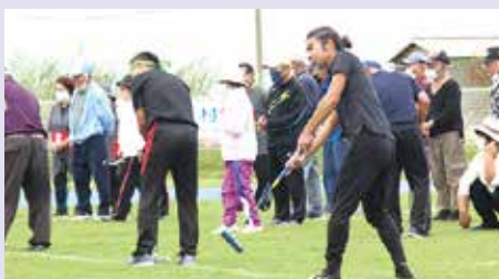
どの顔も真剣、ゲートを目指して打込んだ