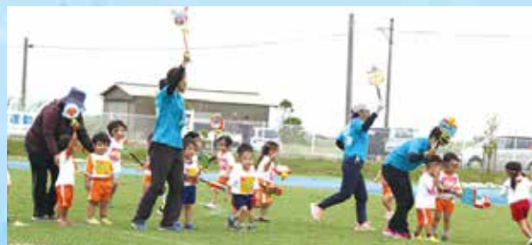
保育園児と幼児による楽しい「カチャーチどんどん」