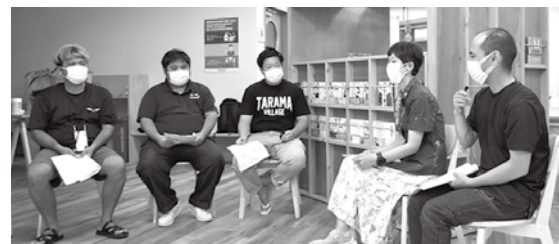
会議参加メンバー