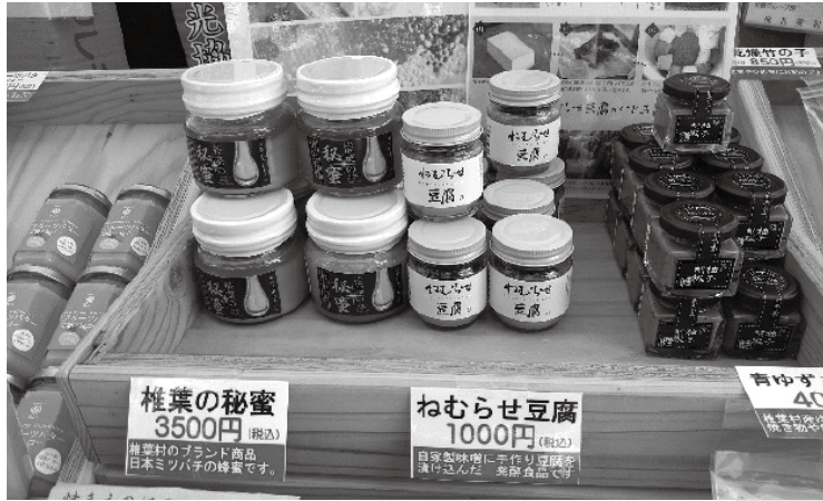
一例として、宮崎県椎葉村の物産の一部です

今回実施できなかった町村に関しては、引き続き5~6月ごろにミニ物産展第二弾を実施する予定であります。皆様も、どの町村が選ばれるのか予想しながら、どうぞ楽しみにお待ちください!