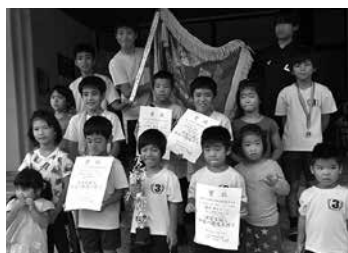
小・中学生の部 優勝 津川チーム