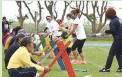
若いレディースも参加。用具も工夫され、しかもカラフルだ