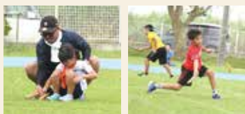
昔取った杵柄?父が手ほどき