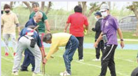
準備に大忙しの役員の皆さん