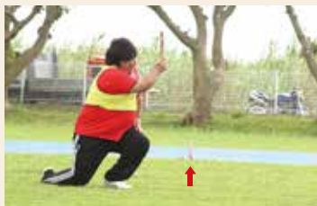
アレ〜??ムツウ飛バン...