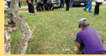
ナワナイの審査基準は長さ、太さ、見栄え等厳格だ