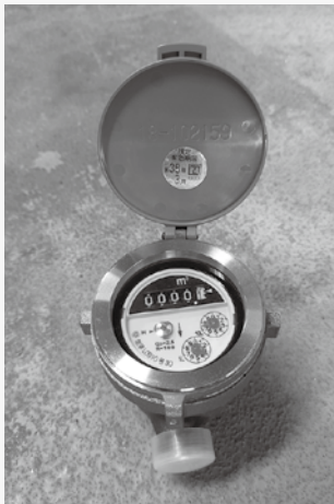
量水器 (水道メーター)

今回ののはなしは、量水器(水道メーター)についてです。 法律のはなしになりますが、水道法では、水道メーターは使用者(村民)で設置することになっていきます。しかし、多くの市町村では、行政(村)が設置し、その使用料を徴収しています。本村においても、水道メーターは、村が設置しています。多良間村給水条例では、水道料金に水道メーターの使用料を加算することとしていますが、現在のところ、村民への負担が増えることを考慮して徴収はしていません。 もう一つ、法律のはなしです。水道メーターは、8年ごとに取り替えなければならぬことになっていきます。メーターは、はかりの一種なので、正確な計量を確保する為に定期的に交換しているのです。 現在、役場から依頼された事業者がメーターを交換しています。屋敷内での作業になるので、皆様のご協力を宜しく願います。