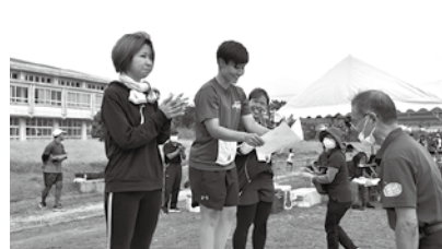
一般女子やり投げ“新記録”の表彰