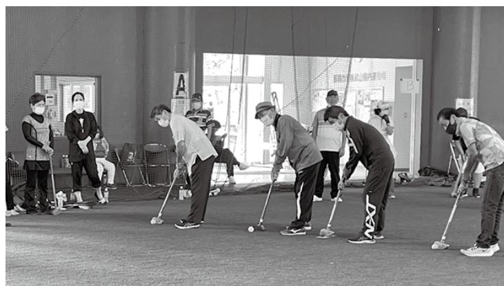
開会式では伊良皆村長、各郷友会会長が始球式を行った