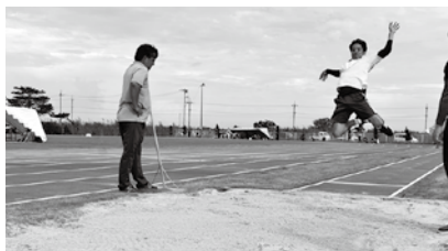
フィールド 40 代走り幅跳