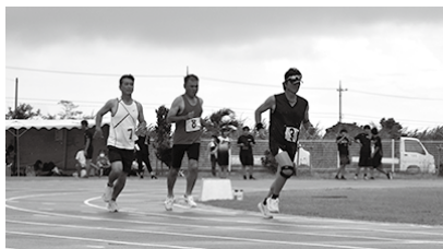
トラック一般男子 5000M