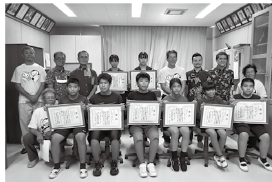
多良間小・中学校受賞者の皆さん

本作文コンテストは、次代を担う全国の小・中学生の皆さんに、犯罪や非行などに関して考えたことや感じたことを作文に書くことを通じて、本運動に理解を深めてもらうことを目的に開催しており、作文コンテストは、平成5年から始まり今年で30回目となる。