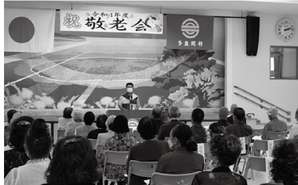
敬老会式典 村長式辞