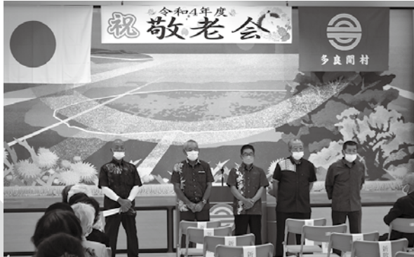
新敬老の皆さんによる挨拶が行われた