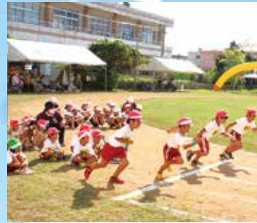
幼稚園、小1・2年生による「かけっこ」