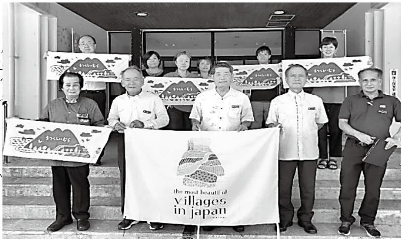
美しい村の日 10月4日 旗掲揚（役場前）