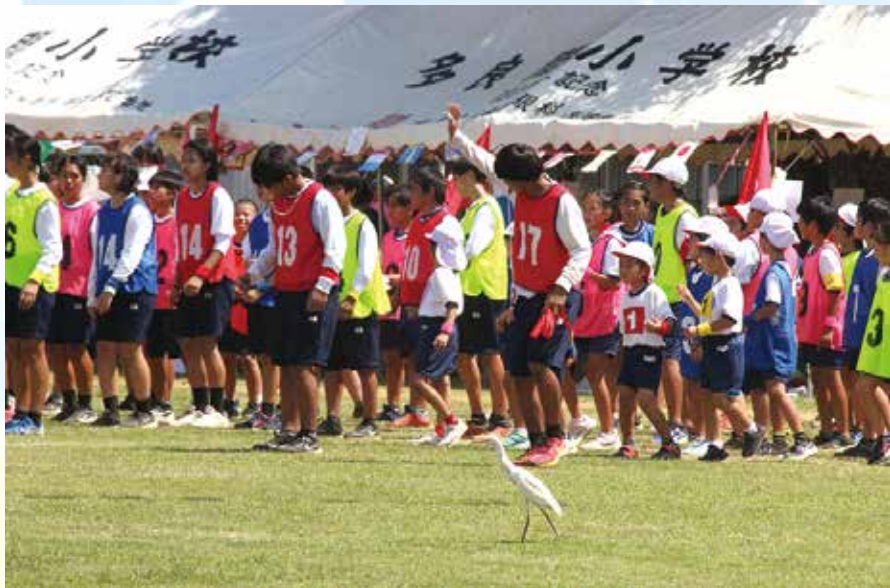
閉会式前の整列の様子。台風11・12号で居残り、島のマスコットになったシラサギも一緒に行進。中学生が小学低学年を誘導する微笑ましい光景