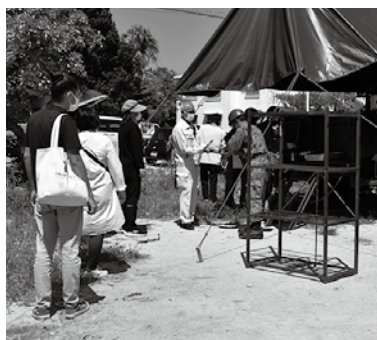
発災後の炊事車による給食支援 (中央スーパー駐車場)