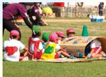
幼稚園児による「レッツチャレンジ」