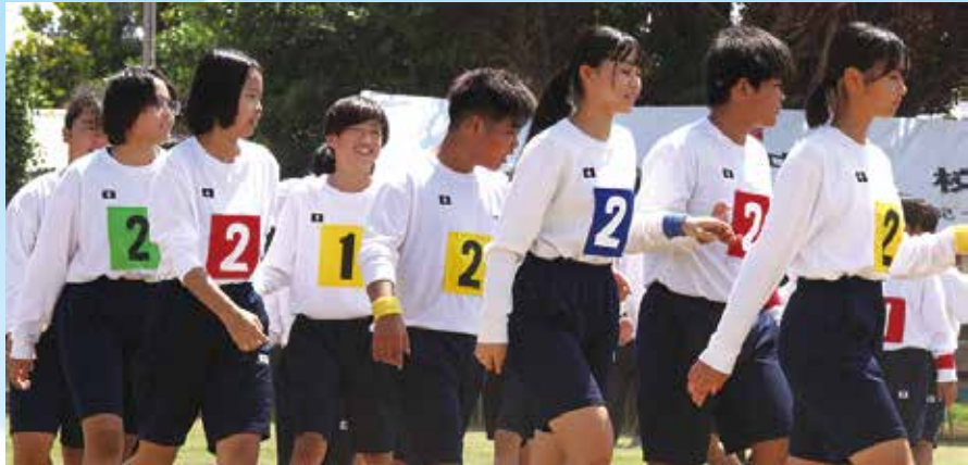
青春の1ページ、伝統のフォークダンスを踊る中学生