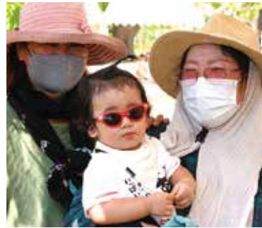
ナイスファッションのファミリーも応援