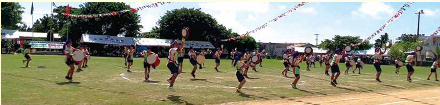
天高く踊れ!小4～中3年による「多良間ふしゃぬふエイサー」。次世代へつないでいくエイサーを運動会で初披露