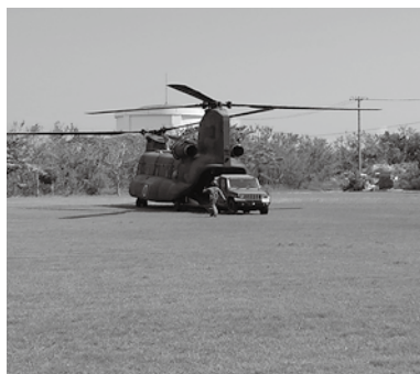
航空輸送訓練 (グラウンドゴルフ場)

訓練の想定:9月27日(火)午前10時、沖縄南東約100kmから先島諸島東約100kmに及ぶ範囲内の3箇所を震源とするM9.0、深さ2Kmの地震が発生。多良間島で震度5強、津波の高さ10mを想定。