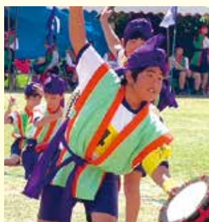
リズム感と呼吸がピッタリの演技で場内を沸かせた