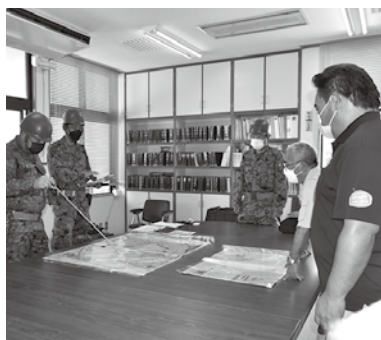
地上偵察訓練 自衛隊と連携し図上訓練を行った。(多良間村役場)