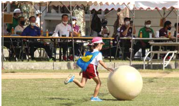
本部席前で軽やかに大玉転がしをする園児

仲間とつなげ 最高の笑顔とストーリー 〜最高の笑顔とストーリー〜 令和4年度運動会スローガンである。 幼稚園、児童生徒の力一杯の演技は、場内を沸かせた。上級生が下級生をいたわる光景は、まさに「多良間っ子の絆」にふさわしい。おじい、おばあ、ご父母、親戚が出そろい子ども達に声援を送る。スポーツの秋、これから陸上競技会、村民運動会と続く。「村民の絆」につながっているものと思う。 (来間)