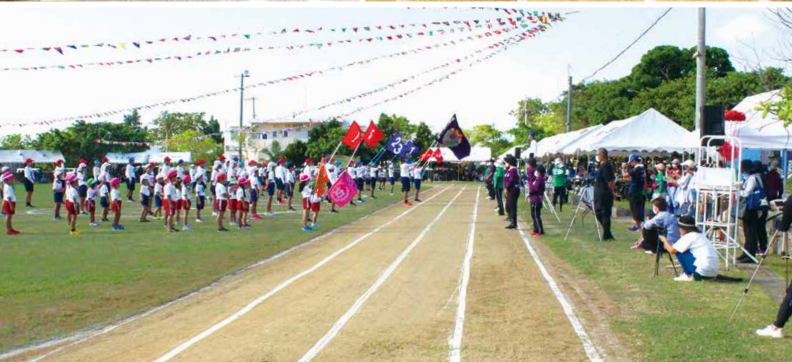
写真 (上左) 伝統のソテツ緑のアーチ (上右) 力走!リレー (下) 開会式