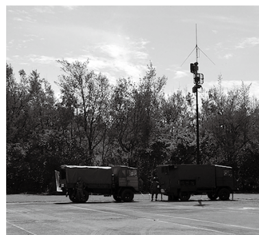
救助活動に必要な通信確保の為の通信訓練 (写真:浄水場・テニスコート場)、コミュニティー施設