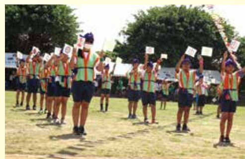
校章と村章を手に「小学校校歌遊戯」を披露する小学生