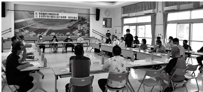
関係者との意見交換会（多良間村コミュニティ施設）

この後、多良間村における農林水産業の概要説明を村産業経済課亀川課長が行い、県の担当者が国営土地改良事業「多良間地区」の概要、「県営・団体農業農村整備事業」、「畜産関係事業」についての説明を行った。