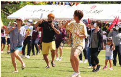
自由参加の地域の踊り「たらびんダンス・あぐがばなどうすがばな」を軽快に踊る