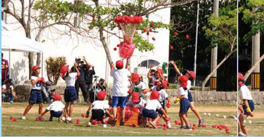
演技・競技名「表現・特技」スローガン「新時代 玉入れ」で一生懸命に赤と白の籠を目指す小学1・2・3年生