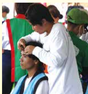
学年を越え先輩達の着付けも手伝う。そこには「絆」がある