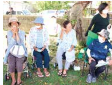
孫の応援をするおばあさんの皆さん