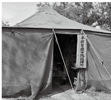
指揮所では、多良間島の被害状況、宮古地区警報区分、気象状況、関係機関の状況、部隊の勤務態勢等の必要な情報が集約。(農村公園)