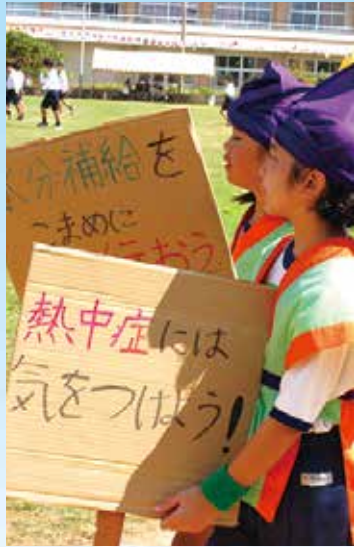
熱中症には気をつけよう!と手作りプラカードで場内を回るエイサー姿が可愛い児童

仲間とつなげ 最高の笑顔とストーリー 〜最高の笑顔とストーリー〜 令和4年度運動会スローガンである。 幼稚園、児童生徒の力一杯の演技は、場内を沸かせた。上級生が下級生をいたわる光景は、まさに「多良間っ子の絆」にふさわしい。おじい、おばあ、ご父母、親戚が出そろい子ども達に声援を送る。スポーツの秋、これから陸上競技会、村民運動会と続く。「村民の絆」につながっているものと思う。 (来間)