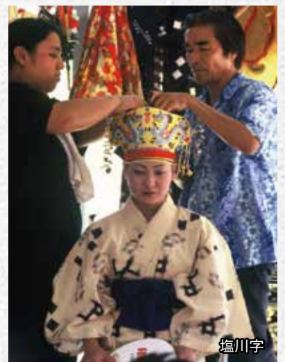
端踊座の着付け風景