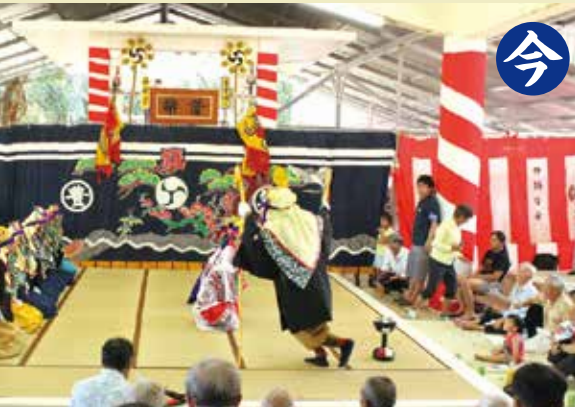
幕の下で演じられる「忠臣仲宗根豊見親組」。与那国島鬼虎一行者観客一体となって盛り上がる。当時はマイクをぶら下げたり、地を直接見ながら演奏していた(土原ウガン1976年)