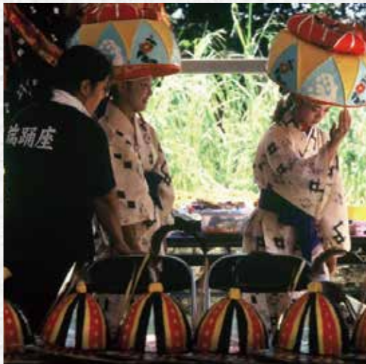
出番前に「女踊り」の演舞を確認をする踊り子と師匠

舞台や観客席は立感がある、との話しも座のフィナーレ定番のティッシュを振り狂が熱くなる(ピトウマタ